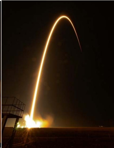
Auf dem Weg zur Raumstation.