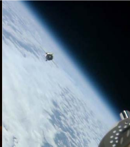
Ankunft an der Raumstation ISS.